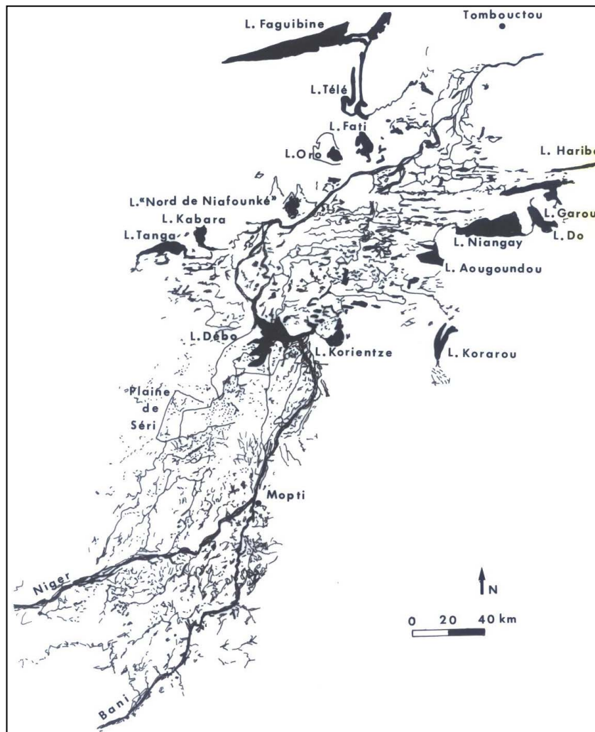
Figure 2. Les principaux lacs, mares et marigots du delta intérieur du Niger.

Au Sud de Tombouctou, le fleuve Niger traverse une très vaste plaine quasiment sans relief qu'il inonde plus ou moins lors de crues annuelles initiées par les pluies tombant entre mai et septembre en Guinée et au Mali, aidé par l'un de ses principaux affluents, le Bani. Cette zone d'inondation, appelée delta intérieur du Niger (DIN) s'étend sur c. 425 km de long et 90 km de large, couvrant c. 35000 km 2 (Fig. 1).